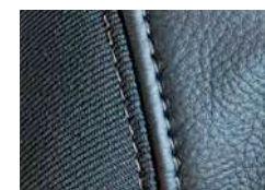
Комбинация кожа / текстиль