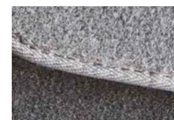
Коврик для ног