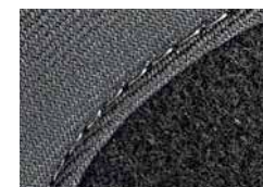
Комбинация ткань / войлок

1 Рекомендация: Применение иглы SAN® 12 2 Рекомендация: Применение иглы SAN® 5